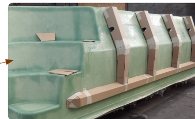
< 07 > Placement des renforts cartonnés