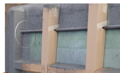
< 08 > Renforts métalliques et cartonnés