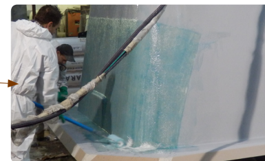
< 05 > Moulage résine ISO + Rovimat 450x500