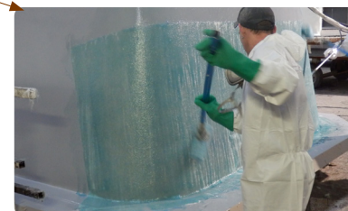
< 04 > Moulage résine ISO + Mat de verre 450g/m 2

> Couches successives d'une paroi de coque polyester Génération Piscine