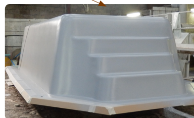
< 03 > Gel coat ISO NPG & Barriere coat