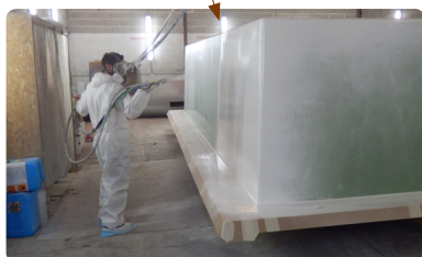
< 02 > Gel coat ISO NPG & Barriere coat