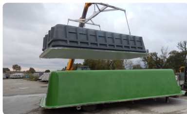
< 10 > Démoulage