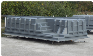
< 11 > Préparation avant livraison