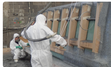
< 09 > Projection Simultanée Fil de verre + résine Ortho